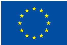
UNION EUROPÉENNE Fonds social européen